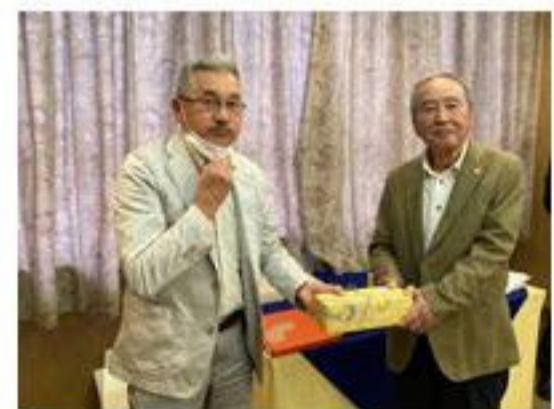
ニアピン賞 篠塚会員