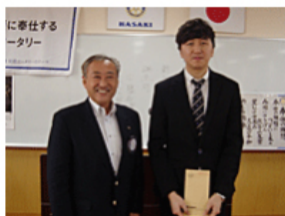
薛載勳米山奨学金